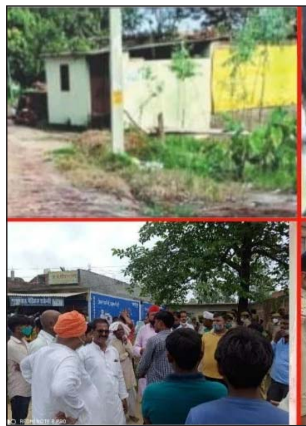
संतकबीरनगर में पुलिस की पिटाई से थाने शख्स की मौत का मामला।

अगर उत्तर प्रदेश सरकार आंकड़े जारी करे तो सच्चाई सामने आ जायेगी कि प्रदेश में योगी सरकार के कार्यकाल में रिक्त पदों का जो बैकलॉग अखिलेश सरकार में था वह जस का तस है। मोटे तौर पर आकलन के आधार पर प्रदेश के शिक्षा, स्वास्थ्य, पुलिस, तकनीकी संवर्ग आदि में सरकारी कर्मचारियों व शिक्षकों के विभागों में रिक्त पदों की संख्या में करीब दो लाख का इजाफा हो गया। यही हाल उत्तर प्रदेश का है।