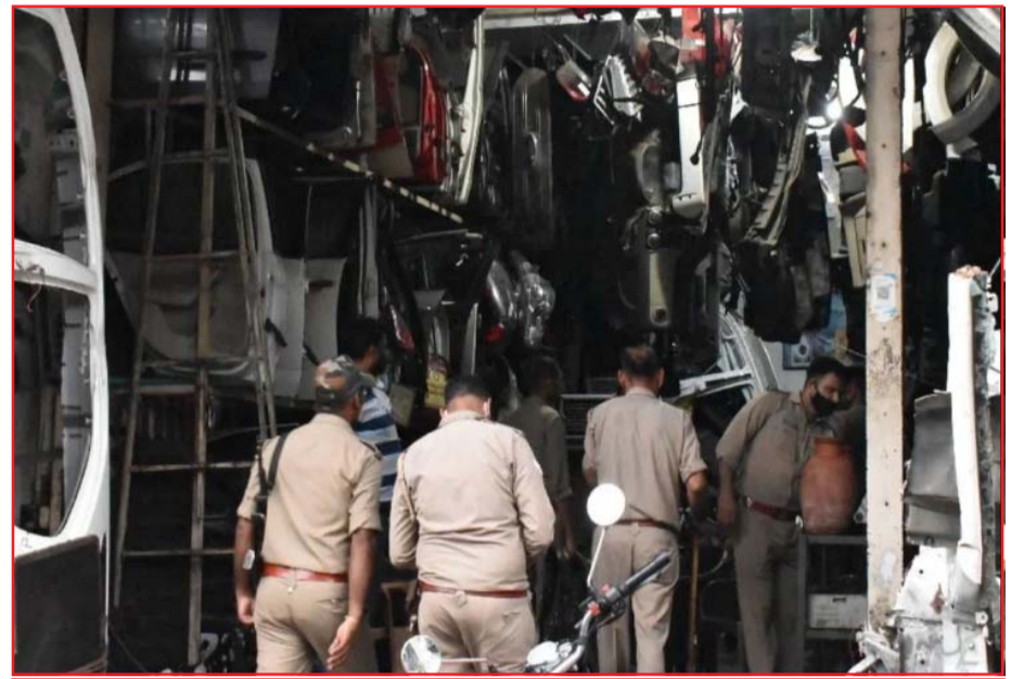
मेरठ के सोतीगंज में कबाड़ियों ने अपने घरों में भी गोदाम बनाए हुए हैं। यहां भी चोरी और लूट की गड़बड़ों के इंजन मिले हैं। सोतीगंज में पुलिस की कार्रवाई जारी है। पुलिस ने गुरुवार को कार्रवाई के दौरान 100 से अधिक इंजन और गड़बड़ों के पार्ट्स बरामद किए हैं। इन्हें सदर थाने में लाया गया है। इसके अलावा तीन लोगों को हिरासत में भी लिया गया है।

में अंतरराष्ट्रीय बैडमिंटन चैंपियनशिप में सिल्वर मेडल अपने नाम किया। 2012 में उन्होंने एशियन जूनियर चैंपियनशिप में गोल्ड मेडल जीता था। वर्ल्ड चैंपियनशिप में जीते 5 मेडल सिंधु ने वर्ल्ड बैडमिंटन चैंपियनशिप में एक गोल्ड सहित पांच मेडल जीते हैं। 2013 और 2014 में उन्होंने ब्रॉन्ज मेडल जीते। 2017 व 2018 में सिल्वर और 2019 में गोल्ड मेडल अपने नाम किया। एशियन गेम्स और कॉमनवेल्थ गेम्स में भी जीत चुकी हैं मेडल सिंधु 2014 इंडियन एशियन गेम्स में विमेंस टीम इवेंट में ब्रॉन्ज मेडल जीतने वाली भारतीय टीम का हिस्सा रही हैं।