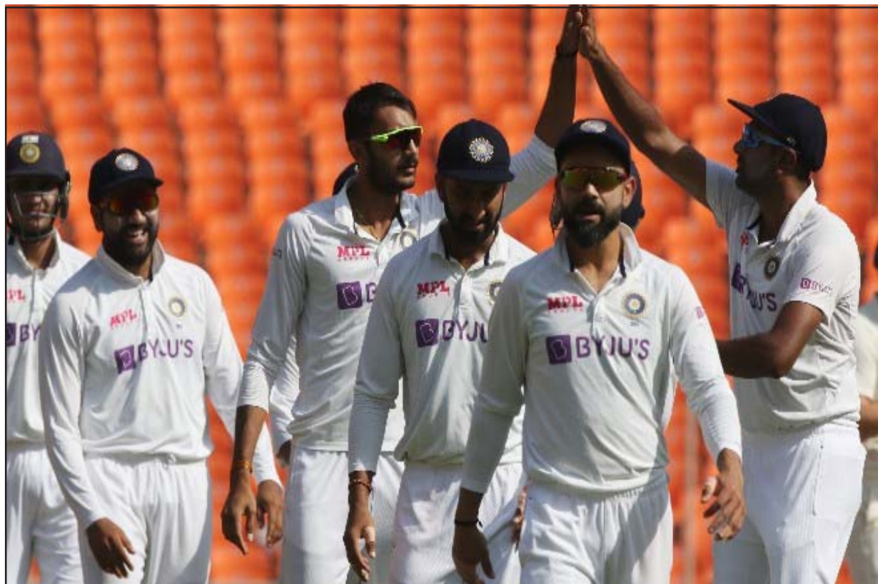
एसजी टेस्ट और न्यूजीलैंड कूकाबुरा गेंदों से खेलता है

चैंपियनशिप शुरू होने से पहले किये गये थे। सुरक्षित दिन की व्यवस्था पांच दिन का मैच सुनिश्चित करने के लिये किया गया है और इसका उपयोग नियमित पांच दिनों के अंदर बर्बाद समय की भरपायी नहीं हो पाने पर ही किया जाएगा। आईसीसी ने कहा, यदि सभी पांचों दिन पूरा खेल होता है और मैच का घेरिणाम नहीं निकलता है तो ऐसी स्थिति में अतिरिक्त दिन नहीं जोड़ा जाएगा और ऐसी स्थिति में मैच को ड्रा घोषित कर दिया जाएगा। मैच के दौरान समय बर्बाद होने की स्थिति में आईसीसी मैच रेफरी नियमित तौर पर टीमों और मीडिया को बताता रहेगा कि सुरक्षित दिन का उपयोग कैसे किया जा सकता है। सुरक्षित दिन का उपयोग करना है या नहीं इसका अंतिम फैसला पांचवें दिन के आखिरी घंटे का खेल शुरू होने पर किया जाएगा। भारत अपने घरेलू मैच