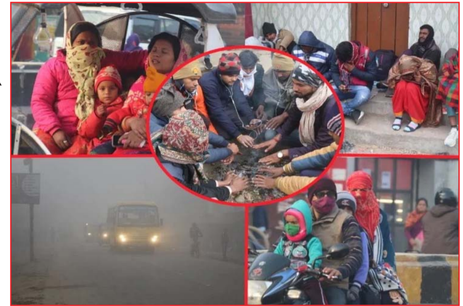
उत्तर प्रदेश के गोरखपुर जिले में पिछले एक सप्ताह के दौरान दिन के बढ़े हुए तापमान ने जहां स्वेटर, जैकेट उतार देने को मजबूर कर दिया था, वहीं मंगलवार को मौसम के एकाएक बदले मिजाज ने कंपकंपी छुड़ा दी। ऐसे में ठंड के कारण शहरवासी ठिठुरते रहे। वहीं सुबह से धूप के भी दर्शन नहीं हुए।

युवाओं पर फोकस यह समारोह संसद के सेंट्रल हॉल में हो रहा है। इस हॉल में हमारी आजादी के निर्णय लिए गए। मन में कल्पना कीजिए, आप उस जगह बैठे हैं जहां देश के वे महापुरुष बैठे थे। देश से आपको कितनी अपेक्षाएं हैं। यहां बैठे युवा साथियों को यह अहसास हो रहा होगा। स्वामी विवेकानंद ने ऐसी संस्थाओं को आगे बढ़ाया जो आज भी व्यक्तियों का निर्माण कर रही हैं। देश में लागू की गई नई नेशनल एजुकेशन पॉलिसी का फोकस भी बेहतर इंजीनियरिंग के निर्माण पर है। यह पॉलिसी युवाओं के कौशल, समझ और फैंसले को सर्वोच्च प्राथमिकता देती है।